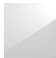
806 Blanc brillant.